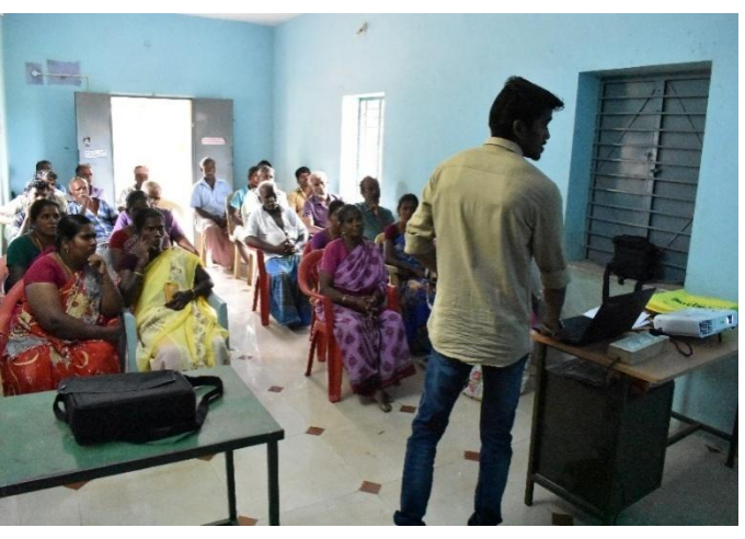
Meeting with farmers -4