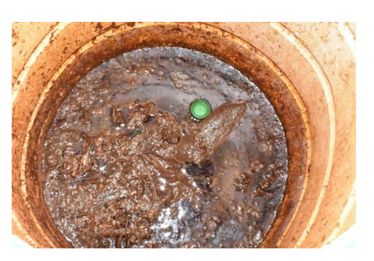
Preparation of bio – fertilizer vermicompost