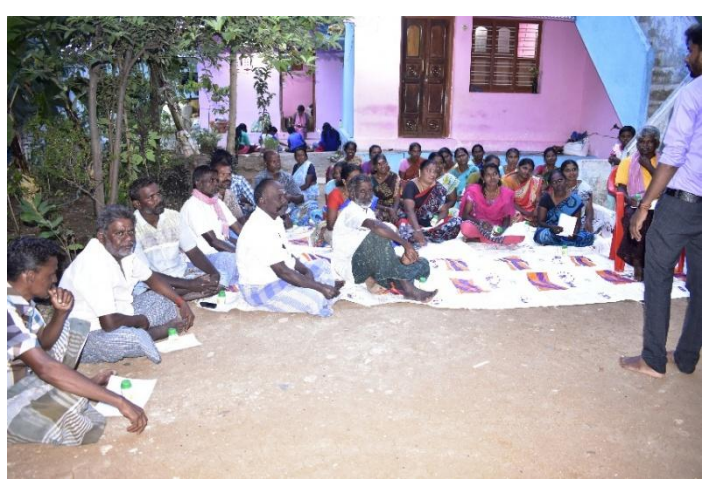
Meeting with farmers - 2