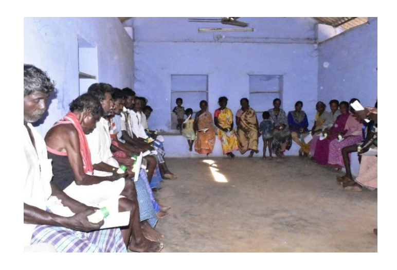
Meeting\ with\ farmers-5